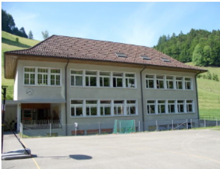
Schulhaus Biembach heute: